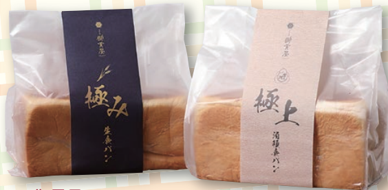
御貢屋 極上 864円 極み 1,000円 (各2斤)