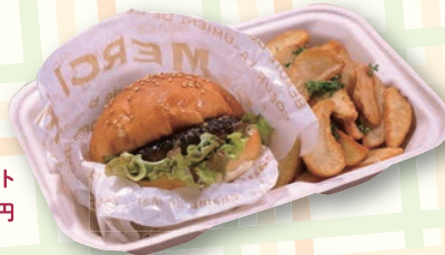
DOLCEVITA 自家製ハンバーグの 照り焼きバーガーセット 648円