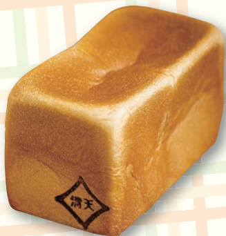
ぱん工房 満天 満天 こむぎ 650円 (1.5斤)