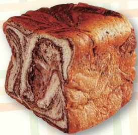
越後長岡カワバタ長岡工場 デニッシュ食パン チョコ 600円 (1斤)