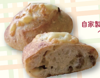
自家製酵母 CoCoPane ベーコンチーズ 430円