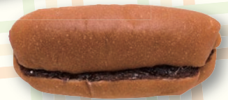
ロイヤル胎内パークホテル ベーカリー LORO あんマーガリン 200円