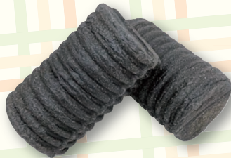
和島トール・モンド パン工房 Harmonie 竹炭ラウンド 260円